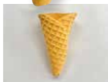
丸めてコーンをつくります。