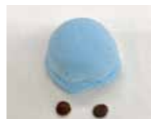
アイスを百目鬼の顔にします。