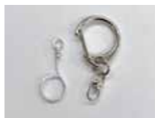
金具を取り付けます。