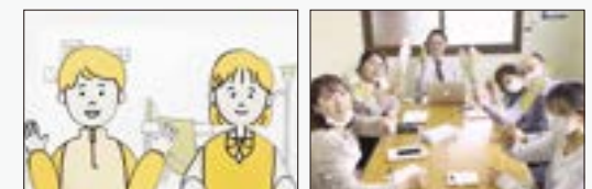
棒人形を使った動画でご紹介