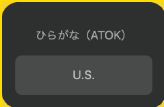
文字入力切り換え画面の例

このショートカットを使用すると、Macの設定によっては“文字の入力切り替え”の画面が表示されてしまう場合があります。